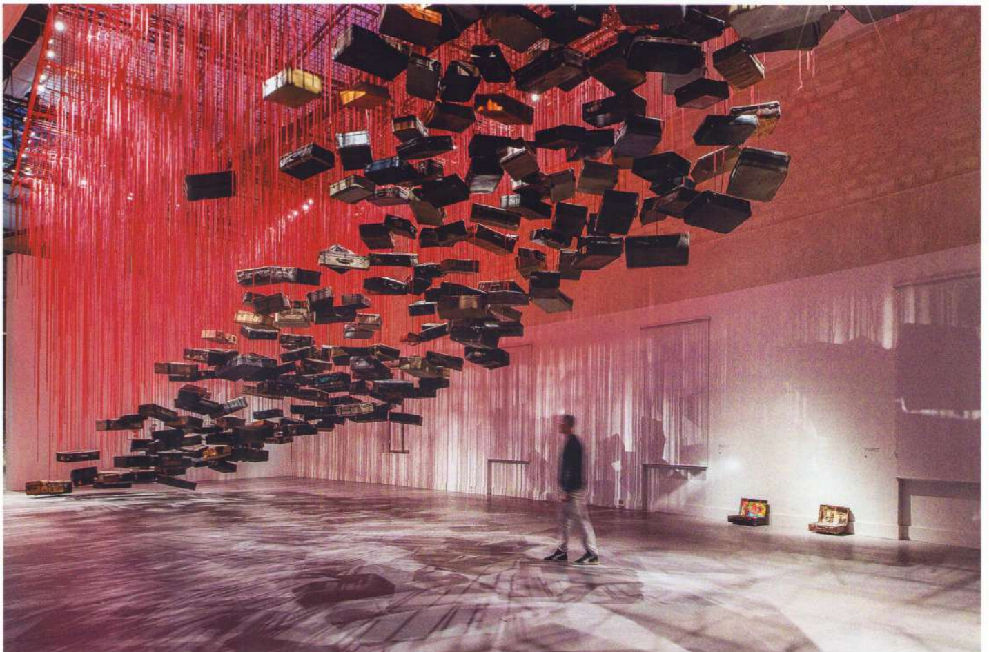
Chiharu Shiota – Accumulation-Searching for the Destination , © GrandPalaisRmn 2024 / Foto Didier Plowy, © Adagp, Paris, 2024 and the artist