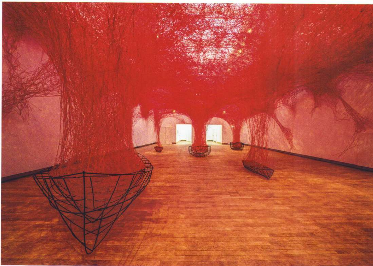
Chiharu Shiota – Uncertain Journey , © GrandPalaisRmn 2024 / Foto Didier Plowry, © Adagp, Paris, 2024 and the artist

Parisul respiră într-o continuă fervoare și mișcare, iar monumentele și muzeele sale nu fac excepție. După redeschiderea catedralei Notre-Dame la final de 2024 și cu Centre Pompidou pe punctul de a intra într-un program de renovare (până în 2030), a venit rândul impresionantului Grand Palais să găzduiască în avanpremieră reînălțării sale oficiale din iunie 2025 o expoziție cu totul specială. Aceasta s-a numit sugestiv The Soul Trembles și a invitat la descoperirea a șapte instalații de mari dimensiuni aparținând artistei japoneze Chiharu Shiota. În completarea acestora, o serie de sculpturi, fotografii, desene ori documente de arhivă au contribuit la înțelegerea parcursului creativ al artistei care se întinde pe mai bine de 25 de ani.