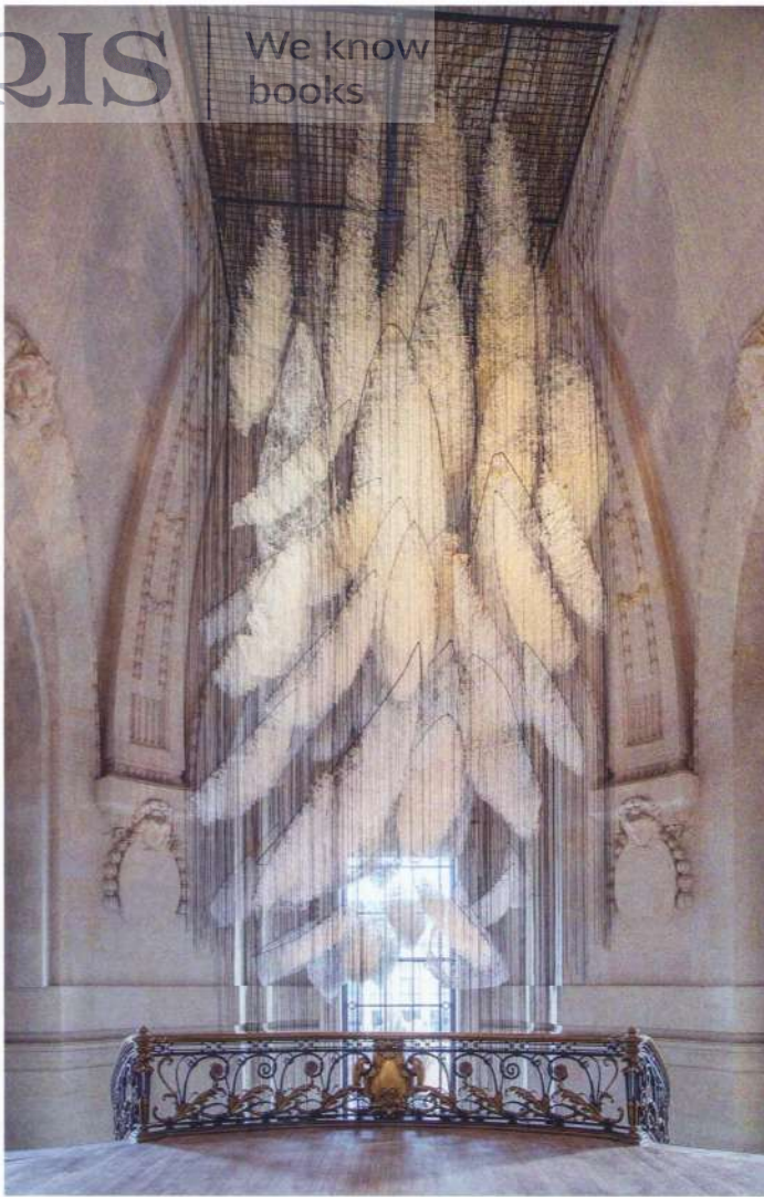
Chiharu Shiota – Where Are We Going? , © GrandPalaisRmn 2024 / Foto Didier Plowy, © Adagp, Paris, 2024 and the artist